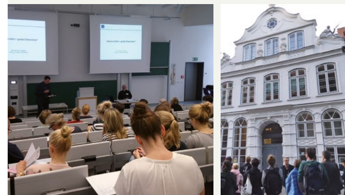
Eindrücke von der Kurswoche 2018 (Plenarvortrag und Stadtführung)

Ein Willkommensempfang, eine Stadtführung und ein Gesellschaftsabend runden das inhaltliche Programm ab.